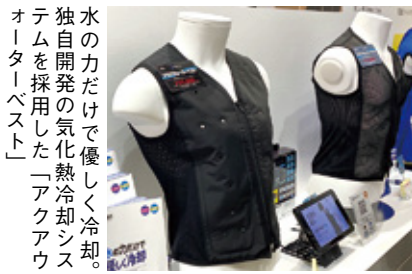
水の力だけで優しく冷却。独自開発の気化熱冷却システムを採用した「アクアウォーターベスト」