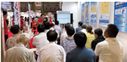
大正製薬(株)では熱中症対策などについての20名限定セミナーを開催