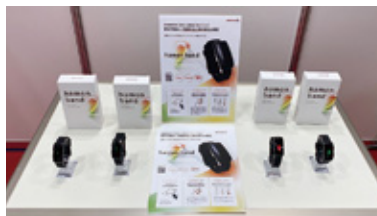
暑熱リスクを可視化するリストバンド型デバイス「hamon band2」