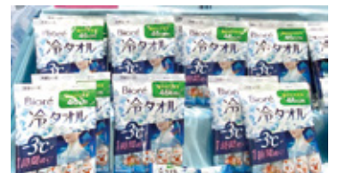
長さ46cmで首にかけるだけで手軽にひんやりできる『ビオレ 冷タオル』