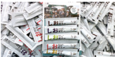
コラーゲンなど5つの美容成分を配合した「ゼネコンがつくったしおゼリー」はオンライン限定販売