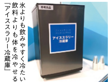
「飲料よりも飲みやすく冷たいアイススラリー冷蔵庫」

7月24～26日に東京ビッグサイト東ホールにて、「第10回猛暑対策展」(主催:一般社団法人日本能率協会)が開かれた。