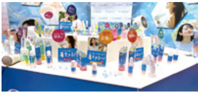
(株)リベルタは「塗るネッククーラー」アセダレーヌや冷感+UVケア「ボディUV」など猛暑対策アイテムが豊富